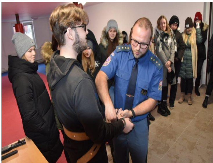
Exkurze do Věznice v Příbrami