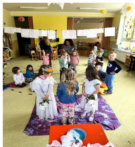
Odborná praxe žákyně 2. ročníku