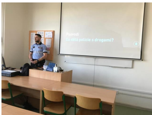
Interaktivní besedy a Tvoje cesta načisto