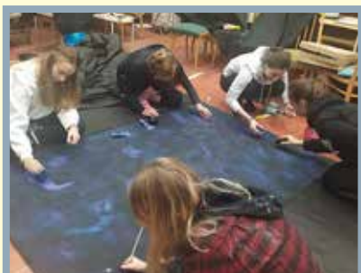
příprava maturitního plesu