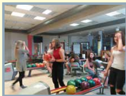
bowling - turnaj