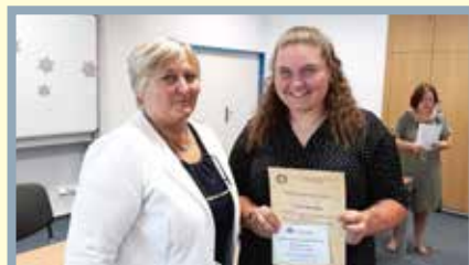
předání maturitních vysvědčení