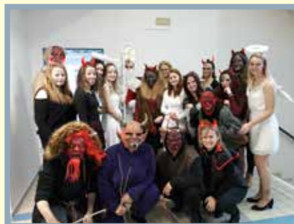
školou chodil Mikuláš